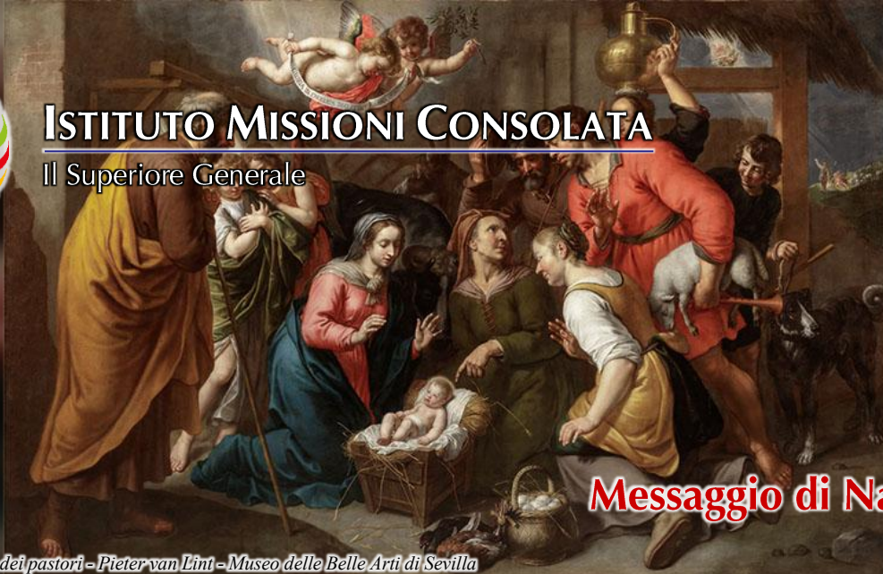
Adorazione dei pastori - Pieter van Limb - Museo delle Belle Arti di Sevilla