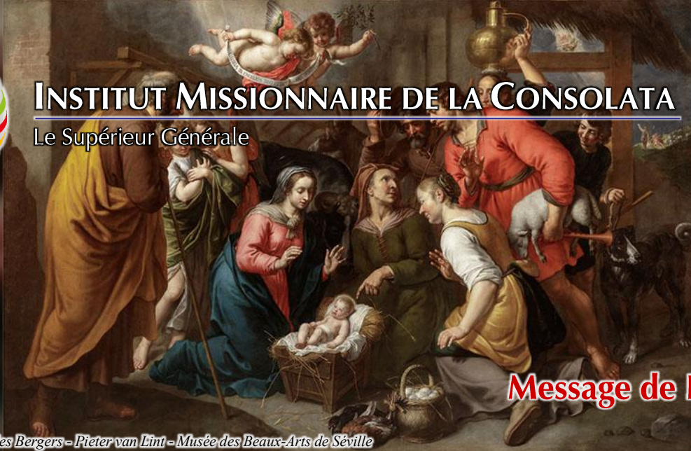
Adoration des Bergers - Pieter van Lint - Musée des Beaux-Arts de Séville