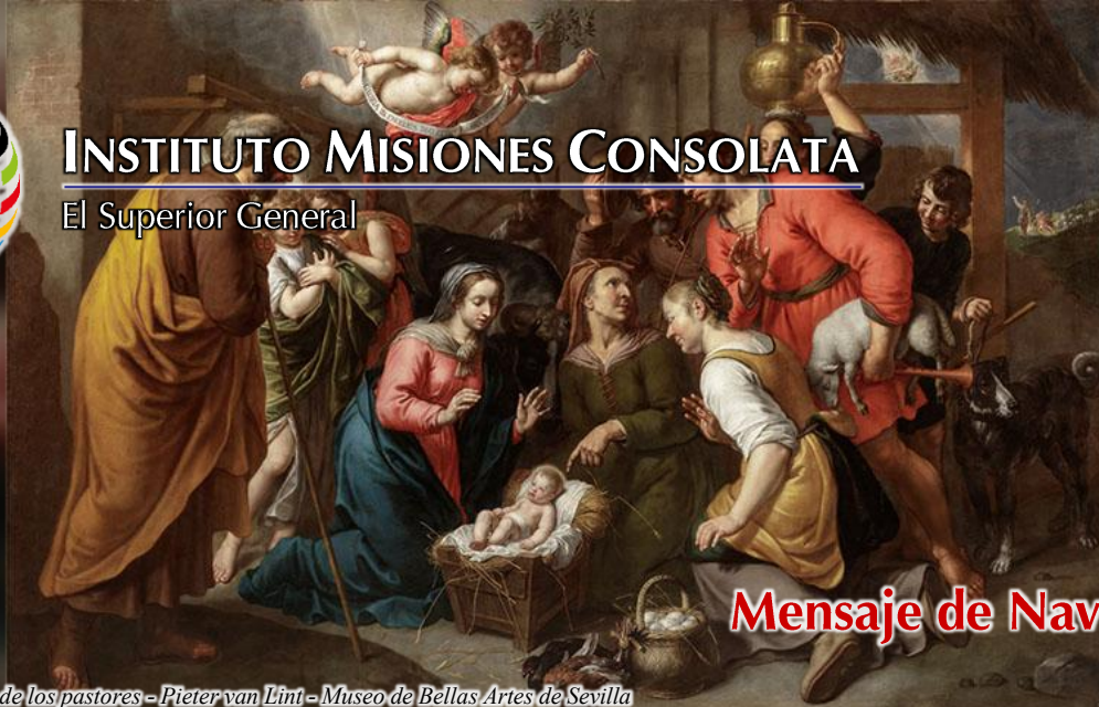
Adoración de los pastores - Pieter van Lint - Museo de Bellas Artes de Sevilla